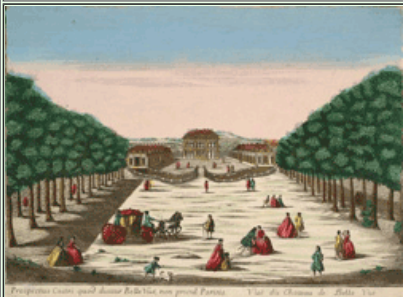
Gravure Château Meudon